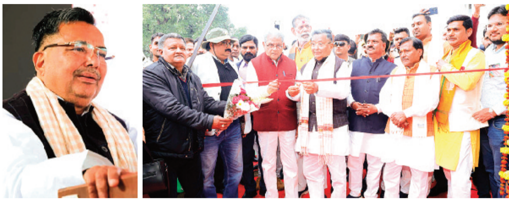
हरिभूमि न्यूज़ ललितपुर